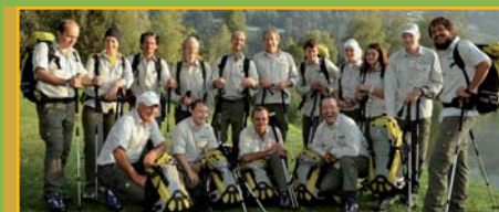
Das Team der Nationalpark Ranger

Im Salzburger Anteil des Nationalparks Hohe Tauern arbeiten 15 ausgebildete Nationalpark Ranger. Neben der Aufsicht im Schutzgebiet ist es für sie ein großes Anliegen, Ihnen die einzigartige Kultur- und Naturlandschaft des Nationalparks näher zu bringen. Was ist eine Meisterwurz und warum hat sie so starke Heilkräfte? Wie nützen die Wildtiere ihren Lebensraum? Was ist das Tauernfenster und wie prägen Gletscher unsere Landschaft? All diese Fragen werden Ihnen die Nationalpark Ranger bei gemeinsamen Wanderungen gerne beantworten.